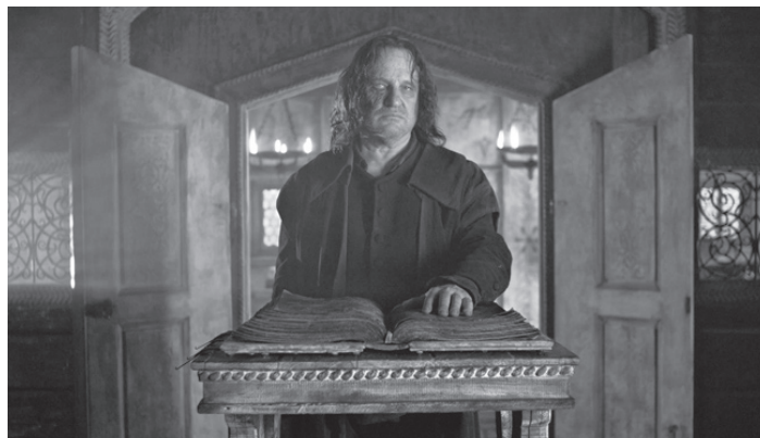
Mylläriellä on synkkiä salaisuuksia.

Esitykset: Plaza 5, ke 18.11, klo 13.00 pe 20.11, klo 17.00 la 21.11, klo 18.00